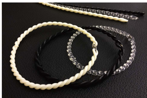
①アイスベルト ②シンワベルトノーマルタイプ(黒) ③シンワベルトノーマルタイプ(クリア)